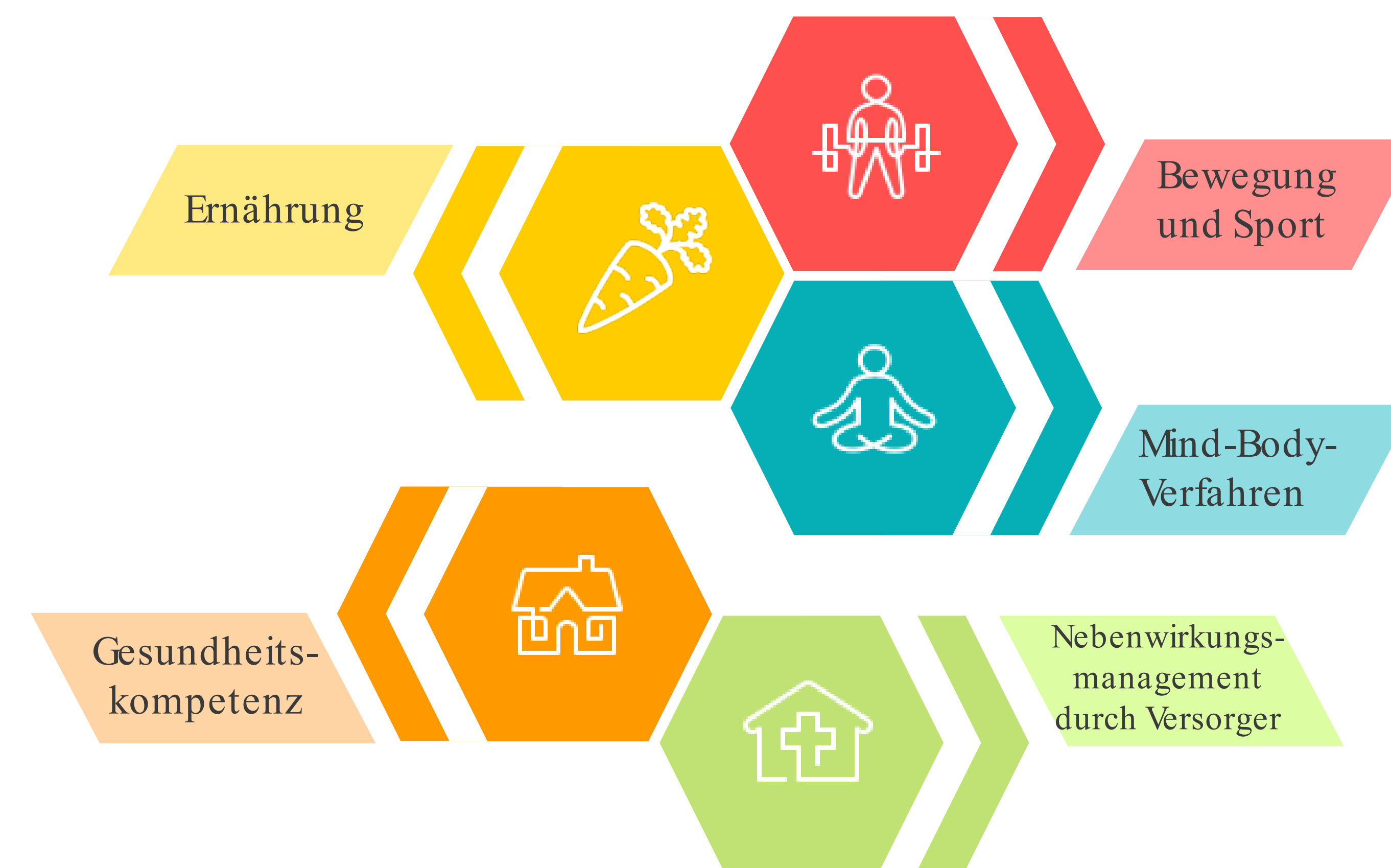
Abb. 1: Integrative Onkologie – Aufbau von Ressourcen (Gesundheitskompetenz, unterstützender Lebensstil), und patientenzentriertes Management von Nebenwirkungen mit Hilfe von evidenzbasierten Komplementärverfahren